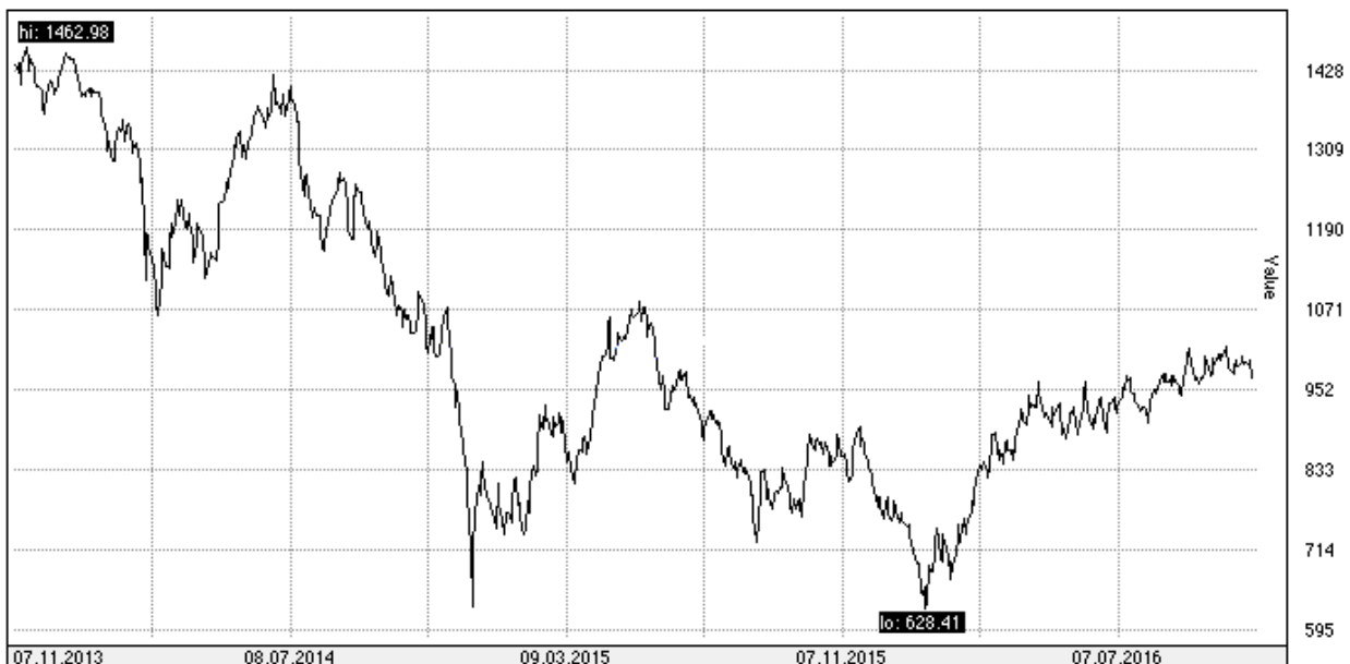
Рис 2. Динамика индекса РТС за 2014 – 2016 гг.