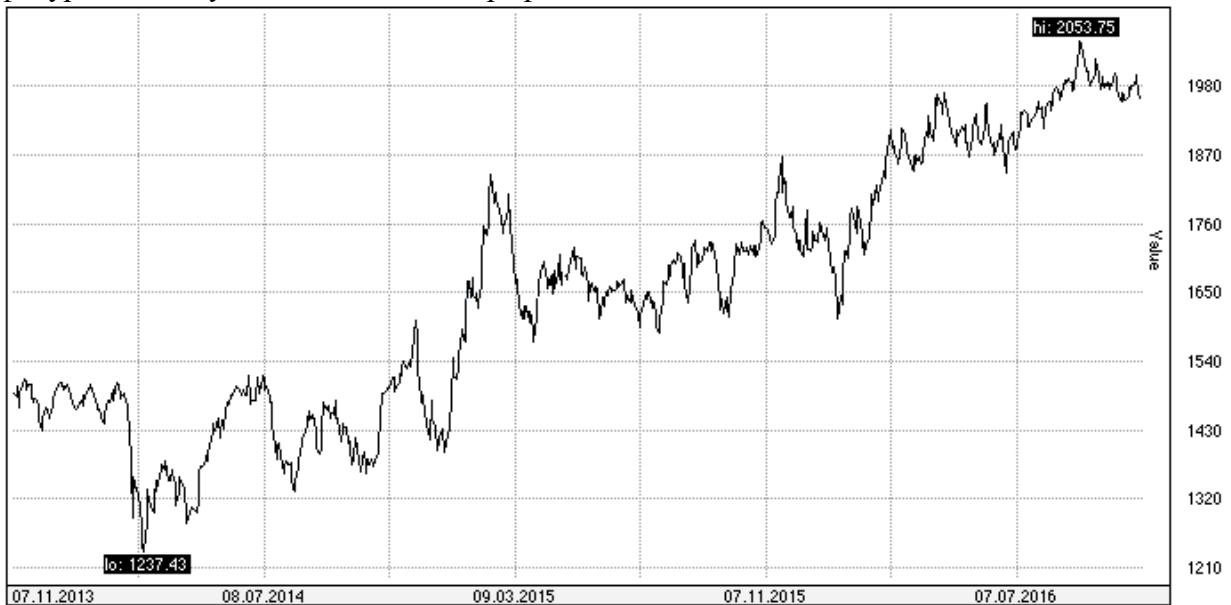
Рис 1. Динамика индекса ММВБ за 2014 – 2016 гг.

Задание 76. Рассмотрите динамику индекса ММВБ и индекса РТС. Охарактеризуйте тенденции данных индексов, начертите линии сопротивления и линии поддержки. Какие фигуры можно увидеть на данных графиках