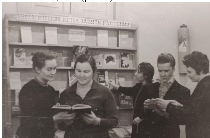
Рисунок 1 – Выставка новых поступлений

Научная библиотека ВСХИ вела работу по улучшению комплектования фонда с учетом всех запросов и потребностей учебного процесса и научной работы, обращая особое внимание на приобретение учебной литературы, научных трудов и справочно-информационных изданий (рис. 1).