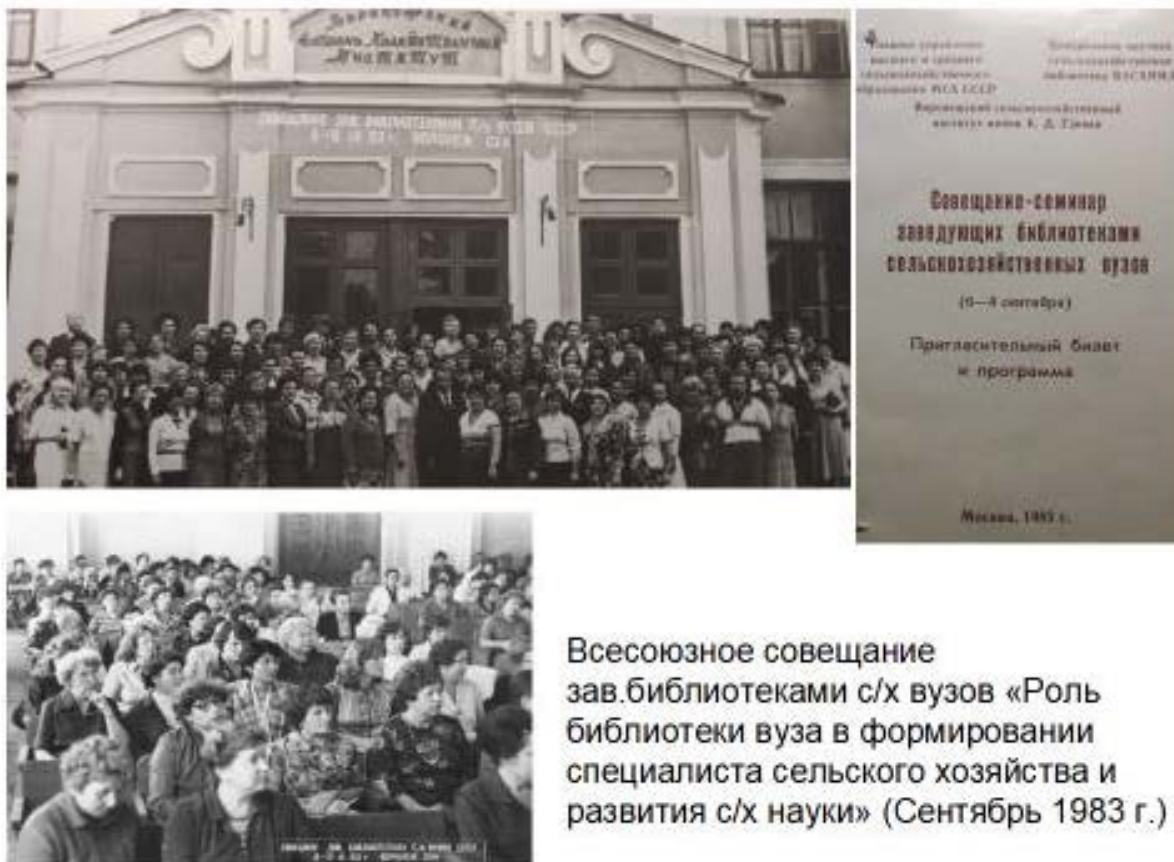
Рисунок 7 – Всесоюзное совещание заведующих библиотеками сельскохозяйственных вузов

вании специалиста сельского хозяйства и развитие сельскохозяйственной науки» (рис. 7).