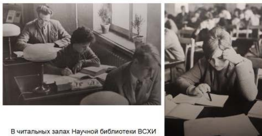
Рисунок 2 – Читальные залы

Имелось 2 абонемена для студентов стационарного обучения, 2 для студентов-заочников, 2 для профессорско-преподавательского состава, а также абонемент художественной и научно-популярной литературы. Работали три читальных зала: 2 студенческих и читальный зал для научных сотрудников (рис. 2).